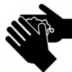
Higiene regular y correcta de manos

Frecuente y meticulosa, durante al menos 40 segundos con agua y jabón, y si no es posible con gel hidroalcohólico durante 20 segundos. Cuando las manos tienen suciedad visible el gel hidroalcohólico no es suficiente.